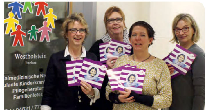
» Das Team vom bunten Kreis präsentiert das Angebot „Familienlotsen“.

Kindern bis zu drei Jahren kommt den Familienzentren ebenso eine besondere Bedeutung zu.