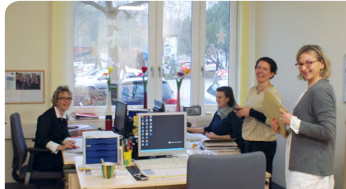
» Die Mitarbeiterinnen des bunten Kreises in den neuen Räumen.