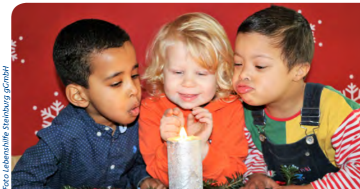
» Lebenshilfe – Motiv der diesjährigen Weihnachtskarte der Lebenshilfe.

Das Ziel ist es, dass die Eltern die Kontaktkarten bei den Ärzten erhalten, um dann den Kontakt zu den Familienzentren bzw. Familienlotsen aufzunehmen. Das Projekt Familienlotse wird durch das Landesprogramm Schutzengel gefördert.