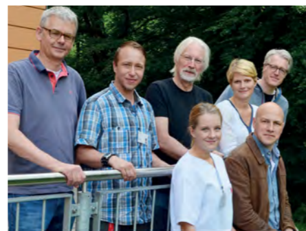
» Das Team des Sozialpädiatrischen Zentrums.

Bislang gab es derartige Einrichtungen in Schleswig-Holstein nur an der Uni Kiel, der Uni Lübeck und im Kinderzentrum Pelzerhaken. Ein langwieriges Antragsverfahren war für die Einrichtung in Itzehoe notwendig, die wie alle SPZs in Schleswig-Holstein über eine Fallzahlbegrenzung verfügt. Der Aufwand hat sich gelohnt: „An der Westküste gab es bisher gar keine entsprechende Einrichtung, Patienten mussten lange Wege nach Hamburg in Kauf nehmen“, sagt Hillebrand. Da dort auch großer Bedarf bestehe, gab es extrem lange Wartezeiten von teilweise über einem Jahr.