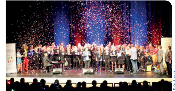
» Tolles Abschlussbild beim Benefizkonzert im September 2017.